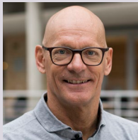
Heinz Frei, 34 Paralympic Medaillen 9-facher Sportler des Jahres Sportlegende

«Glückliches Alter dank Aktivität! Ich finde es grossartig, dass Menschen, die uns durch ihr Engagement ein Vorbild sind, geehrt werden!»