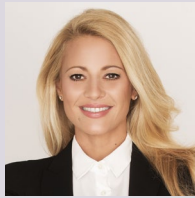
Christa Rigozzi, Moderatorin und ehem. Miss Schweiz

Die Verleihung der Limmex Medaille am 28. November 2018 im KKL wird moderiert von Christa Rigozzi: