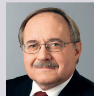
Samuel Schmid, Alt-Bundesrat

Die Verleihung der «Limmex Medaille - Für aussergewöhnliche Menschen über 65» findet am 28. November 2018 im Kultur- und Kongresszentrum Luzern (KKL) statt. Die Gewinner werden im festlichen Rahmen durch die prominente Jury und durch ein öffentliches Voting auserkoren. Folgende Persönlichkeiten sitzen in der Jury: