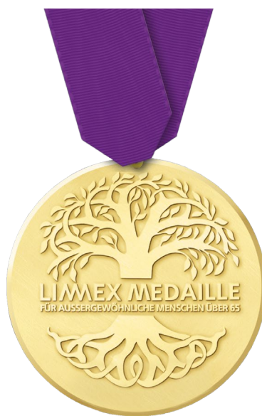
Die Limmex Medaille 2018

In der Kategorie Wirtschaft suchen wir Menschen, die auch nach der Pensionierung einen aussergewöhnlichen Beitrag an die Schweizer Wirtschaft leisten und somit Inspiration für eine aktive Teilnahme am Puls der Wirtschaft sind.