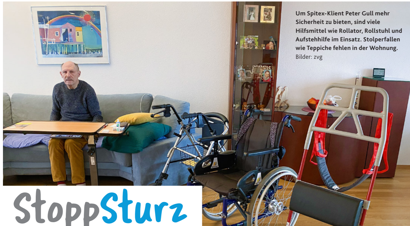
Um Spitex-Klient Peter Gull mehr Sicherheit zu bieten, sind viele Hilfsmittel wie Rollator, Rollstuhl und Aufstehhilfe im Einsatz. Stolperfallen wie Teppiche fehlen in der Wohnung.